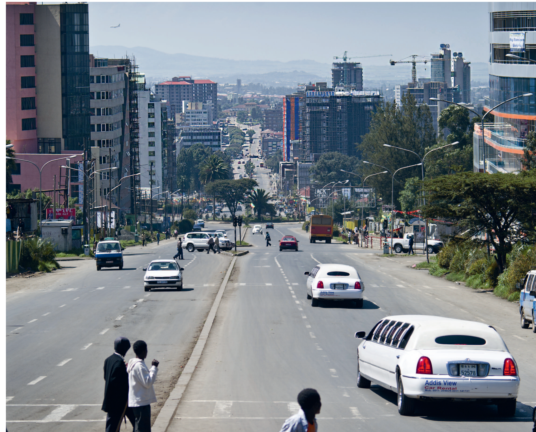
Jaarlijkse economische groei van 8 procent is zichtbaar in straatbeeld van Addis Abeba

Na Nigeria is Ethiopië met bijna negentig miljoen inwoners het tweede land van Afrika. Commentatoren lijken superlatieven tekort te komen voor de prestaties van het land in de Hoorn van Afrika. Het eerdergenoemde Doing Business in Africa bestempelt het als 'groeimachine': de snelst groeiende economie van Afrika en na China en India de derde groeieconomie ter wereld. Het Britse weekblad The Economist verwacht tussen 2011 en 2015 een gemiddelde economische groei van ruim 8 procent, nadat de regering in de hoofdstad Addis Abeba de afgelopen jaren steevast 'dubbele cijfers' presenteerde. In het straatbeeld van Addis, zoals de stad met ruim vier miljoen inwoners vaak wordt afgekort, is de tendens waarneembaar. Overall in het centrum staan betonnen geraamtes met steigers van houten takken: de kantoren van de toekomst. Wegen worden verbreed en van rioleringen voorzien (helaas niet altijd meteen achter elkaar) en een Chinese constructie maatschappij legt een netwerk aan van tram-