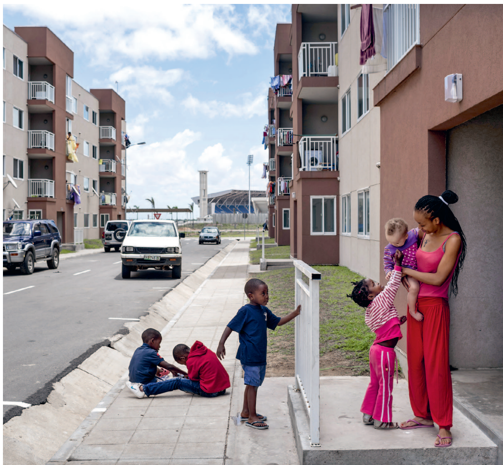
Een 'Vinex'-achtige wijk in Maputo, de hoofdstad van Mozambique