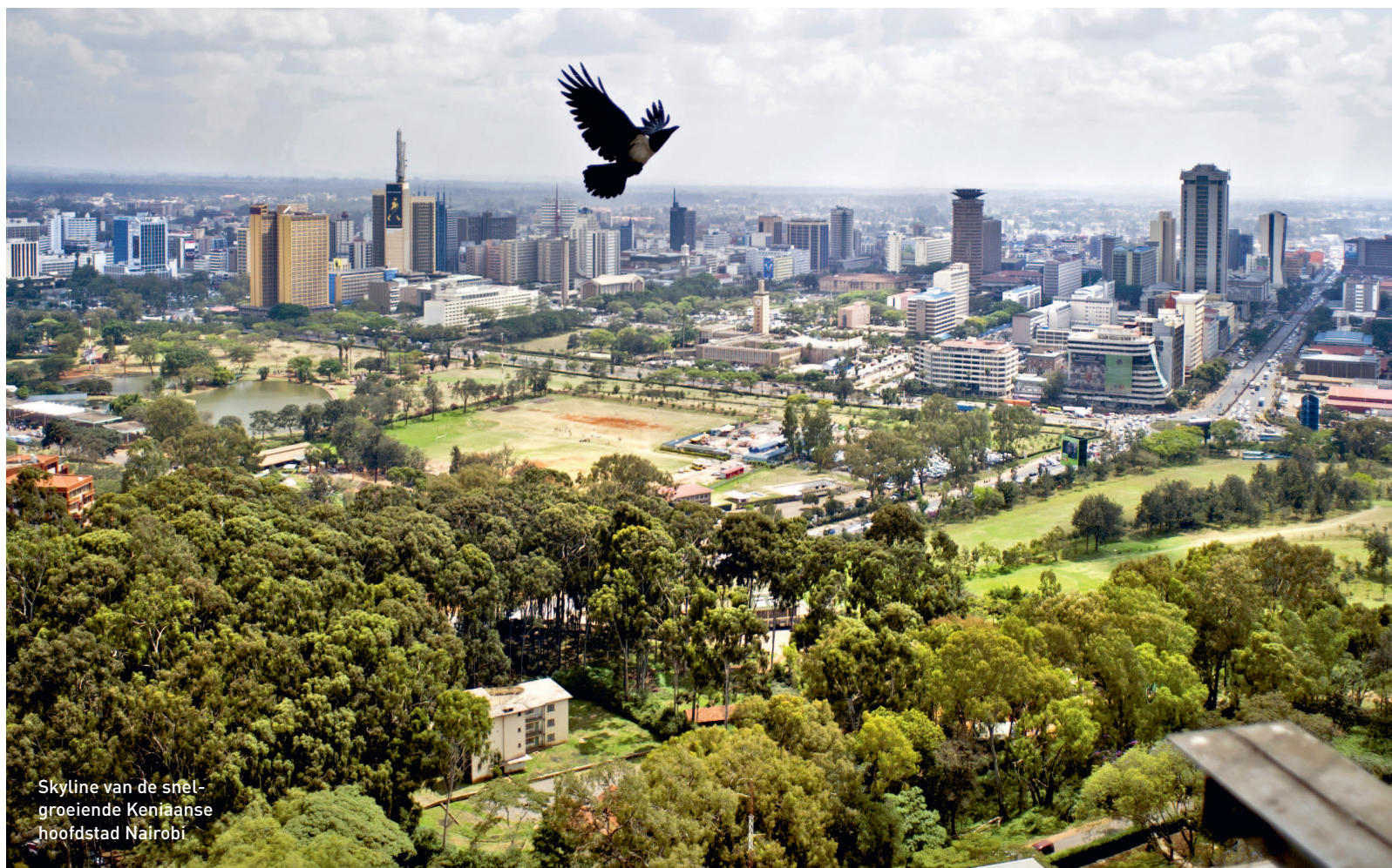
Skyline van de snel-groeiende Keniaanse hoofdstad Nairobi