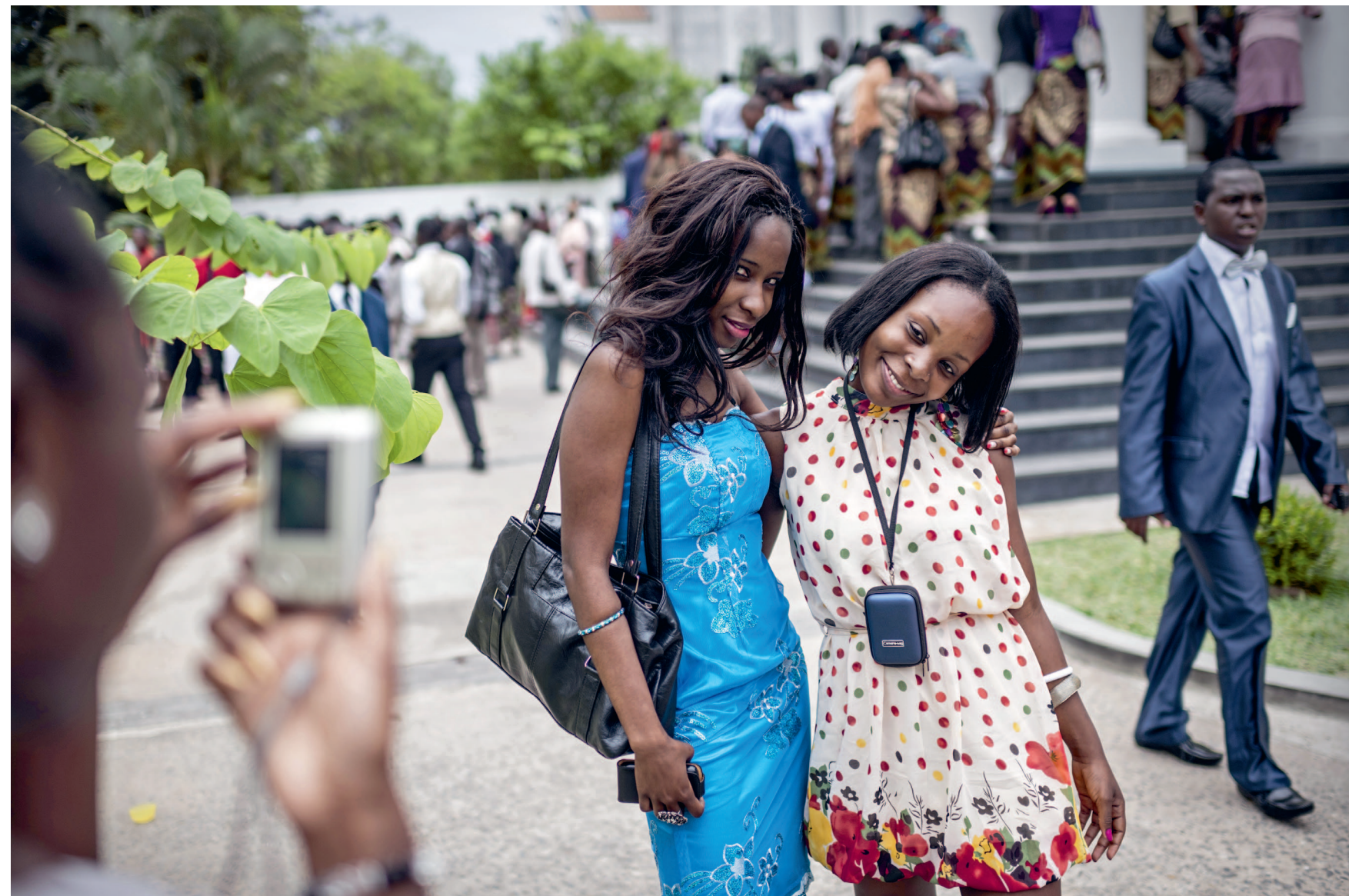
Vrolijkheid tijdens een huwelijk in Maputo, Mozambique

Elsevier Just neemt u mee door het moderne Afrika. We beginnen in de Democratische Republiek Congo, al een halve eeuw een van de meest geplaagde landen van het continent, en steken vervolgens de grens over naar het bergstaatje Rwanda, berucht vanwege de genocide van 1994. In West-Afrika maken we een stop in Nigeria, waar bijna een op de vijf Afrikanen woont, en we eindigen in Ethiopië, jarenlang hét symbool van hongersnood en hulpcampagnes.